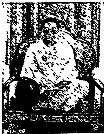
श्री मट्टारक चावकीतिजी महाराज मट्टारक मुडवद्री पीठ